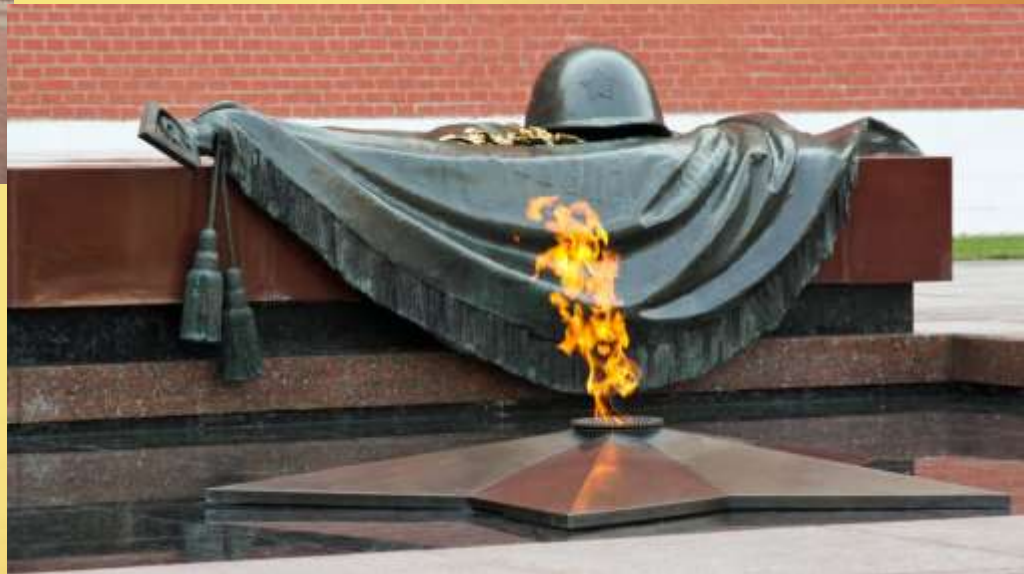
Могила Неизвестного Солдата г. Москва