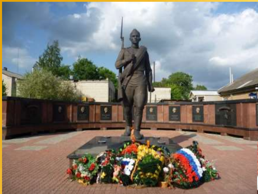
Мемориал 60-летия Победы г. Мышкин Ярославской области